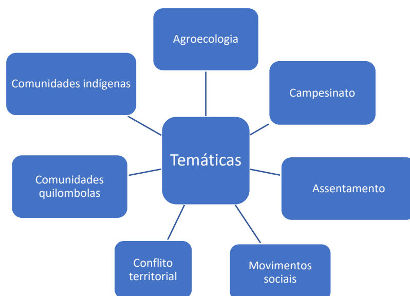
Diagrama 1 – Principais temáticas em que o conceito de território foi discutido

Nesse contexto, as principais temáticas presentes nos artigos que faziam revisões aprofundadas do conceito de território foram: assentamentos rurais, conflitos territoriais, movimentos sociais, questões relacionadas às comunidades indígenas, comunidades quilombolas, agroecologia e campesinato, entre outras. Abaixo segue um diagrama que ilustra algumas das principais temáticas presentes nos artigos analisados: